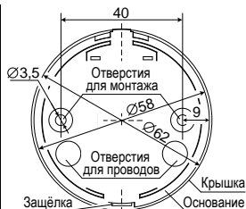
Рис.3 Задняя стенка. Расположение отверстий для монтажа. Присоединительные размеры

Величина оконечного резистора Rок определяется в соответствии с техническим описанием ППКП