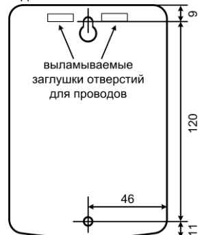
Рис.2 Присоединительные размеры