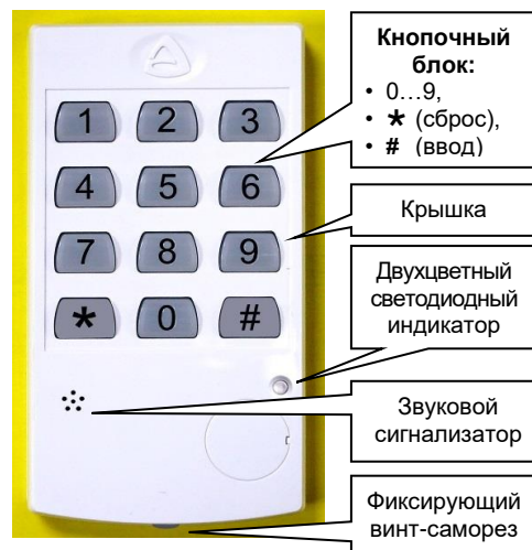
Световая индикация и звуковая сигнализация КП:

Время ожидания каждого следующего нажатия кнопки – 3 секунды, при большем интервале происходит отмена набора и КП выходит из режима приема кода.